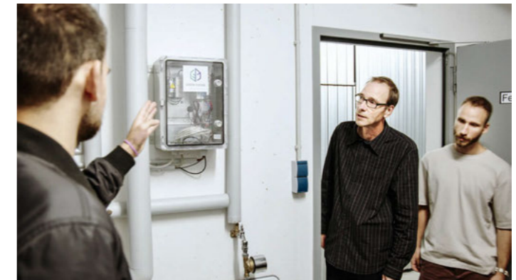
Schnittstelle von Green Fusion im Heizungskeller

ein genau abgestimmter und effizienter Betrieb, angepasst an das Nutzerverhalten, die klimatischen Bedingungen und die jeweilige Anlage.“ Neben den Einsparungen gebe es einen weiteren überzeugenden Vorteil im digitalen Heizungskeller: „Da die Software permanent mit den angeschlossenen Heizungsanlagen vernetzt ist, erkennt sie potenzielle Störungen sofort und meldet diese sofort per E-Mail an den zuständigen Mitarbeiter. Oftmals, bevor es zu einem Vorfall, zum Beispiel einem Ausfall, kommt.“