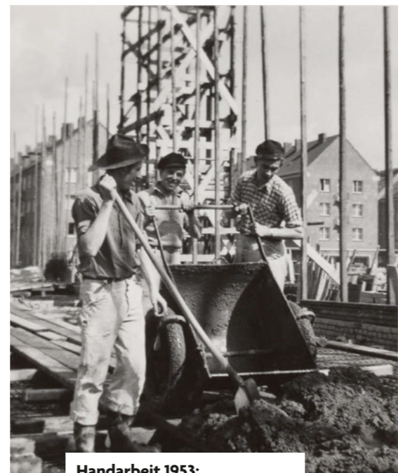
Handarbeit 1953: Eine Baustelle am Horner Weg