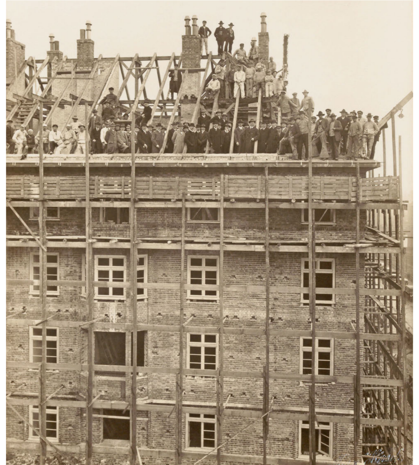
Echt stark! Blick auf ein Richtfest. Die dhu wurde im Jahr 1925 gegründet. 1928 wurde der Bau des „Großwohnhauses“ an der Ecke Goldbekufer/Forsmannstraße gefeiert.