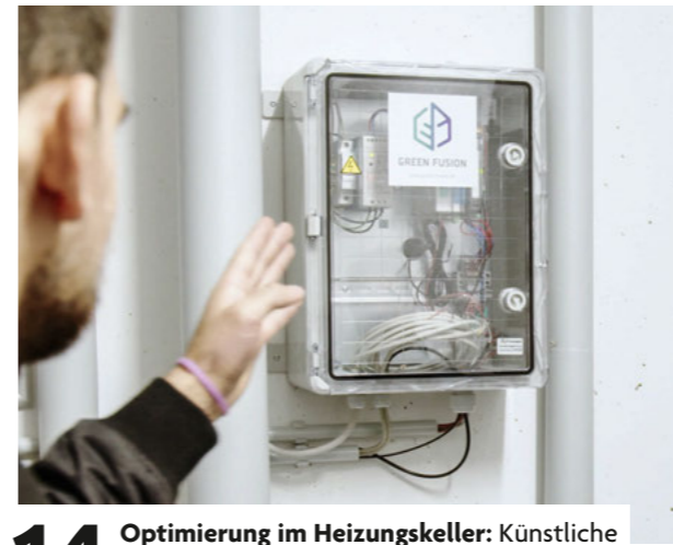
14 Optimierung im Heizungskeller: Künstliche Intelligenz hilft bei CO 2 -Reduktion