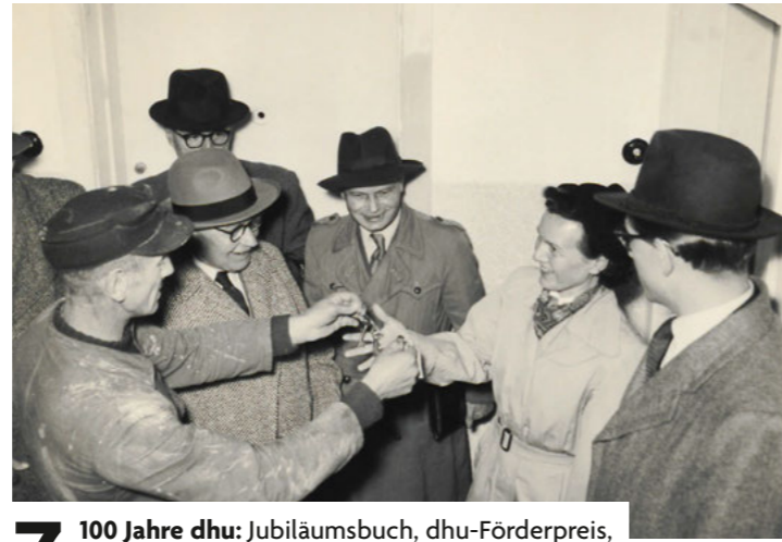
7 100 Jahre dhu: Jubiläumsbuch, dhu-Förderpreis, Geburtstagsfeiern und vieles mehr