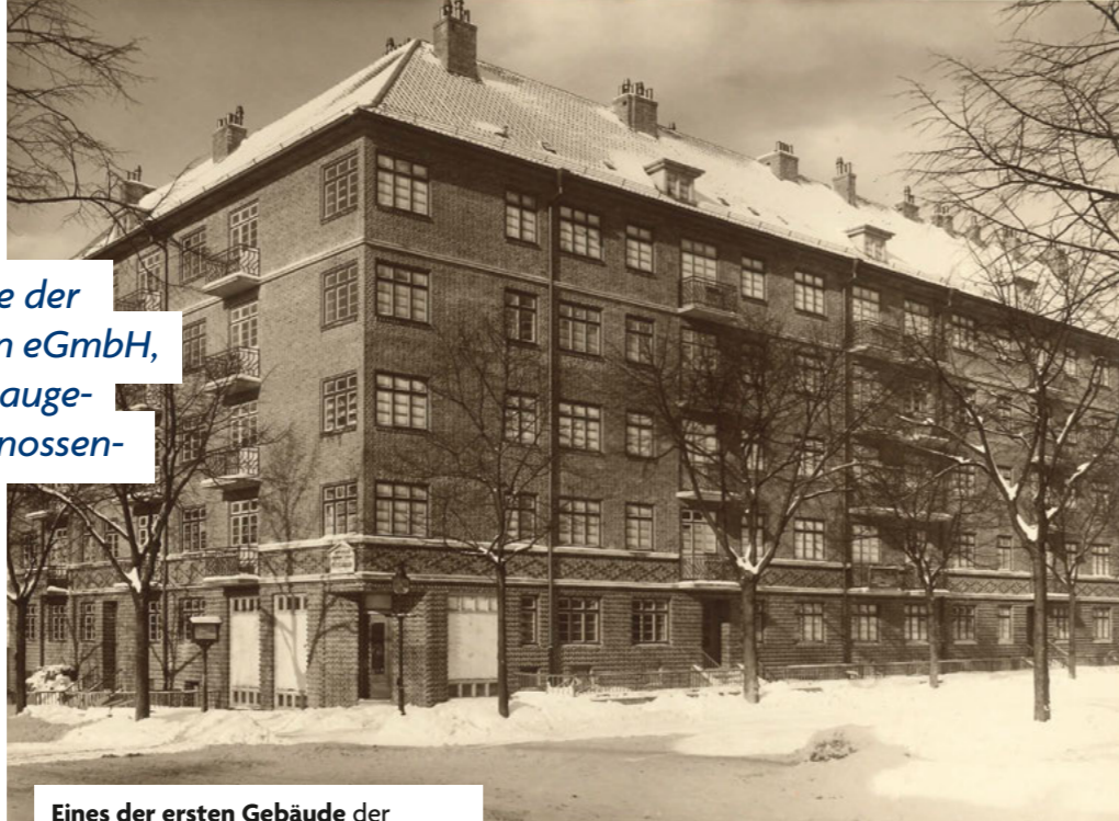
Eines der ersten Gebäude der jungen Genossenschaft 1928/29 Ecke Himmelstraße/Timmermannstraße

Die Idee der Selbsthilfe gab vor 100 Jahren den Anstoß: Die Gründer der heutigen dhu erkannten in der Unternehmensform der Genossenschaft eine Möglichkeit, gemeinsam sicheren und bezahlbaren Wohnraum zu schaffen. Im Mai 1925 erhielt die Genossenschaft am Goldbekufer in Winterhude einen ersten Bauplatz und bereits im Dezember begann der Bau von 30 Wohnungen in der Semperstraße.