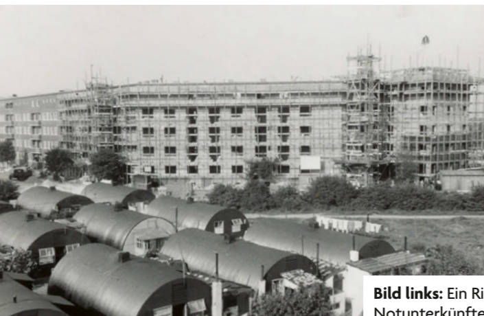
Bild links: Ein Richtfest 1951 vor Nissenhütten, den Notunterkünften der Nachkriegsjahre, am Elisabethgehölz in Hamm. Rechts: Strahlende Gesichter bei einer Schlüsselübergabe in den 50er-Jahren in Blankenese

Im Jubiläumsjahr wächst Stein um Stein das jüngste Bauvorhaben heran: In der Steilshooper Straße/Ecke Schlicksweg entsteht Raum für Wohnungen und eine neue Geschäftsstelle. Die Geschichte der Baugenossenschaft dhu? Sie wird weitergebaut.