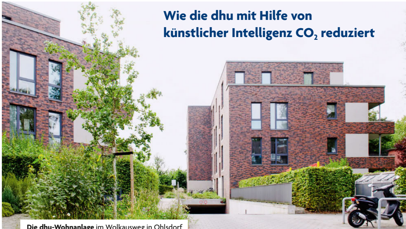
Die dhu-Wohnanlage im Wolkausweg in Ohlsdorf

Wie die dhu mit Hilfe von künstlicher Intelligenz CO 2 reduziert