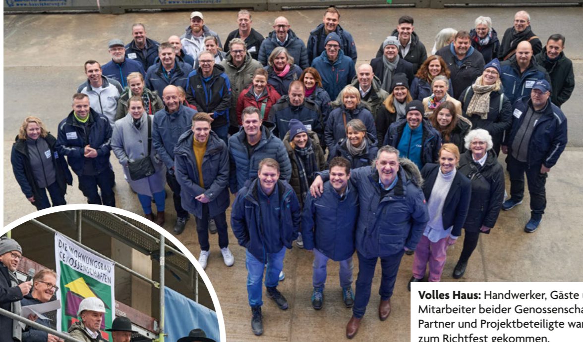
Volles Haus: Handwerker, Gäste und Mitarbeiter beider Genossenschaften, Partner und Projektbeteiligte waren zum Richtfest gekommen.

Richtfest für das Bauprojekt Steilshooper Straße/Schlicksweg