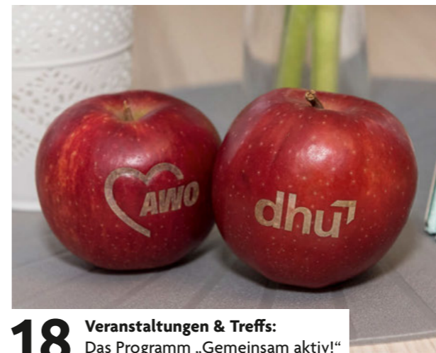
18 Veranstaltungen & Treffs: Das Programm „Gemeinsam aktiv!“ der dhu und ihrer Partner