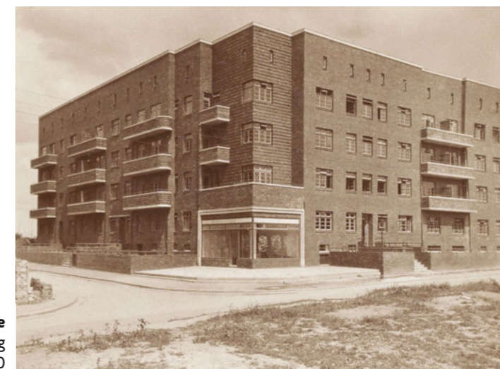
Gebäude an der Ecke Buchsbaumweg/Efeuweg bei der Entstehung 1930