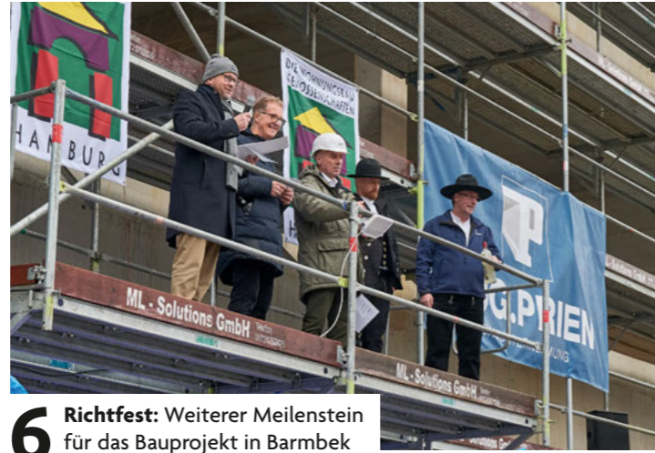
6 Richtfest: Weiterer Meilenstein für das Bauprojekt in Barmbek