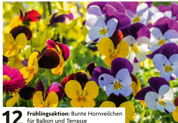
12 Frühlingsaktion: Bunte Hornveilchen für Balkon und Terrasse

In dieser Ausgabe: Die Beilage für unsere dhu-Kinder